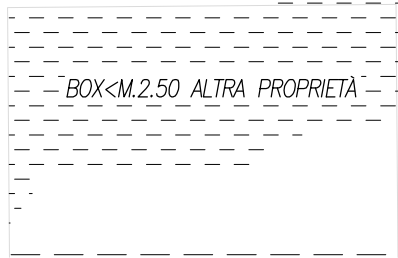
PLANIMETRIA GENERALE PIANO TERRA